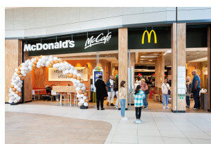
Centre commercial Ermont