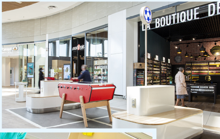
Espace détente Centre Commercial Ermont