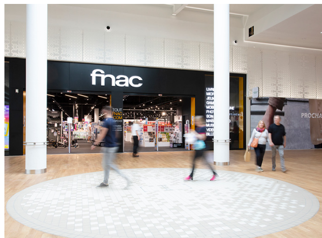
Installation de la Fnac à Shop'in Houssen

Le portefeuille de projets de Galimmo SCA est centré sur les programmes déjà autorisés et les opportunités au sein des sites existants, avec une approche adaptée au cas par cas, le cas échéant en lien avec l'hypermarché.