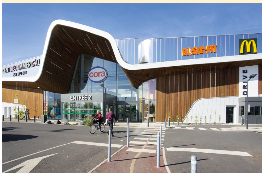
Centre commercial Ermont